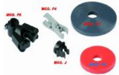
MOD. P1 / P2 / P4 / P5 / J

PROTECTORES Y JUEGOS DE PINZA. Dichos accesorios se pueden acoplar a toda gama de carros.