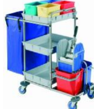
MOD. 565 / 12 lt.

MEDIDAS: Abierto L 122 x An 56 x Al 107 MEDIDAS: Cerrado L 87 x An 70 x Al 104