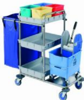
MOD. 565 / 730

CARRO Súper Limpieza, con 3 bandejas de polipropileno, chasis acero inox.18/8, 1 bolsa plastificada, 4 cubos de 6 lt. asa telescópica, 2 ruedas de 125 Ø y 2 ruedas de 100 Ø con paragolpes. Con cubo Mod. 730.