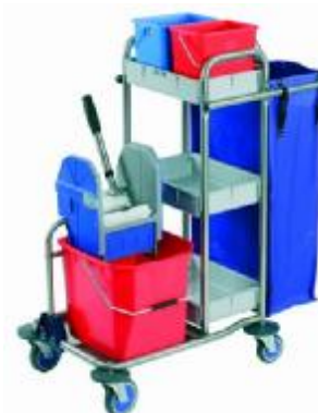
MOD. 575/25 lt.

MEDIDA ABIERTO: L95 x An53 x Al 106 MEDIDA CERRADO: L78 x An53 x Al 106