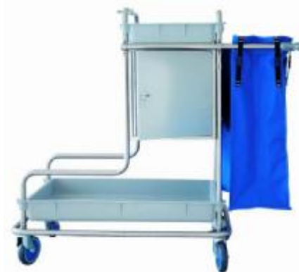
MOD. 50 AR

CARRO 2 bandejas plástico polipropileno, color gris, chasis cromado, 1 bolsa plastificada, asa telescópica, ruedas de 125 Ø, con armario de acero inox.18/8 con cerradura. (Medidas Armario: Alto 37 x Ancho 37 x Fondo 47).