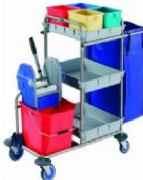
MOD. 565 / 25 lt.

MEDIDAS: Abierto L 122 x An 56 x Al 107 MEDIDAS: Cerrado L 87 x An 70 x Al 104