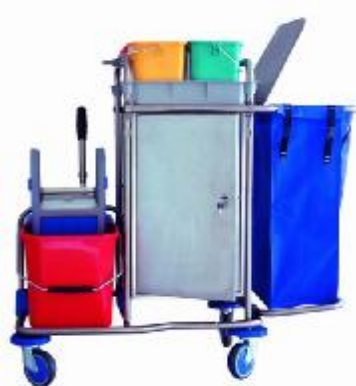
MOD. 560 AR

MEDIDA ABIERTO: L95 x An53 x Al 106 MEDIDA CERRADO: L78 x An53 x Al 106